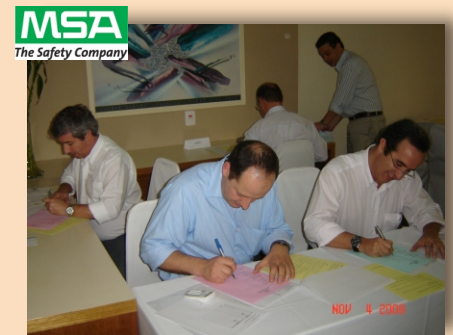
MSA do Brasil Equip. e Instr. Segurança Seminário executivo seis sigma São Bernardo do Campo - SP