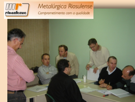
Metalúrgica Riosulense Seminário executivo seis sigma Rio do Sul - SC