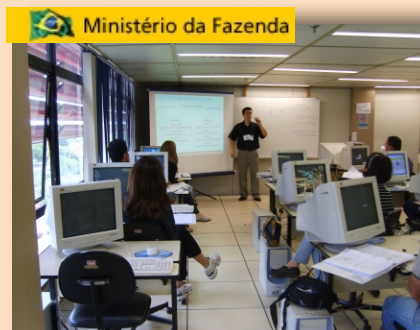
Ministério da Fazenda Métodos Estatísticos e Índices de Desempenho Brasília - DF