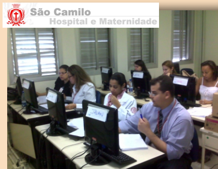
Hospital e Maternidade São Camilo Treinamento em Desenvolvimento de Pesquisa de Satisfação São Paulo - SP